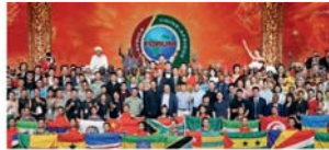
中国民间文艺演出