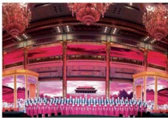
人民大会堂金色大厅国事演出